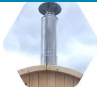
ZERTIFIZIERTER SCHORNSTEIN 2,7 M