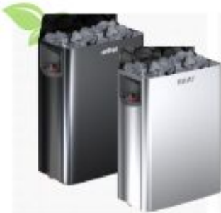
HARVIA THE WALL 4,6-9KW