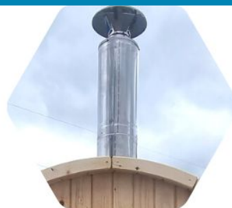
ZERTIFIZIERTER SCHORNSTEIN 2,7 M