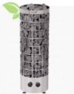
HARVIA CILINDRO PC 90