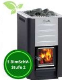
HARVIA 20 PRO