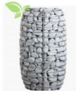
HUUM HIVE MINI