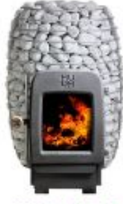
HUUM HEAT THE LEGEND LS