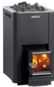
HARVIA 20 PRO SL