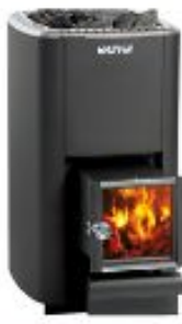
HARVIA M3 SL